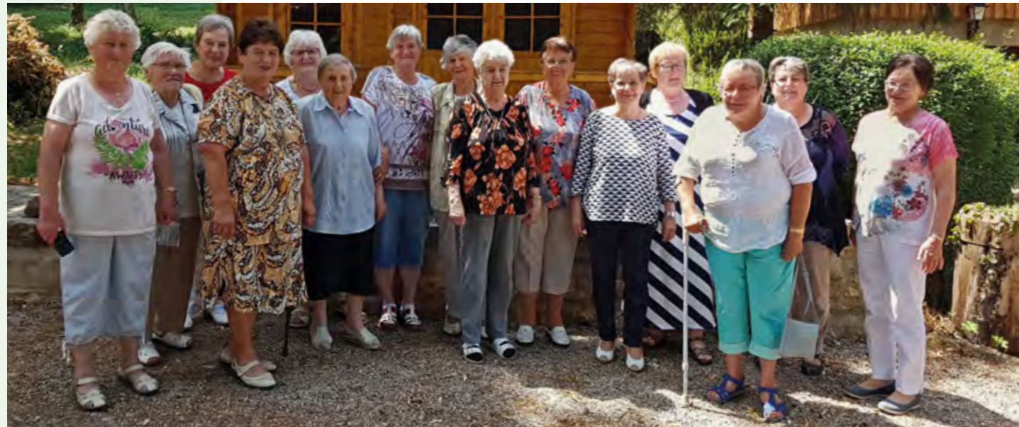
Frauenkreis Bilzingsleben, Juli 2018

Zum Verständnis der verschiedenen Altersphasen